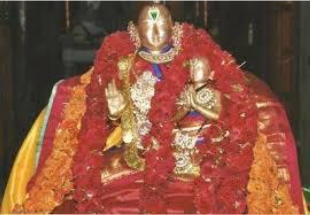
நடாதூர் அம்மாள் -ஸ்வாமி தேசிகன்

திருவெள்ளறையை விட்டு, ராஜபாளையத்துக்குச் சற்றுத் தெற்கே உள்ள 'கொல்லங்கொண்டான்' என்னும் ஊரில் இருந்தார். நடாதூர் அம்மாள் அங்கும் சென்று அவருக்குக் கைங்கர்யங்கள் செய்து காலட்சேபம் கேட்டார்.