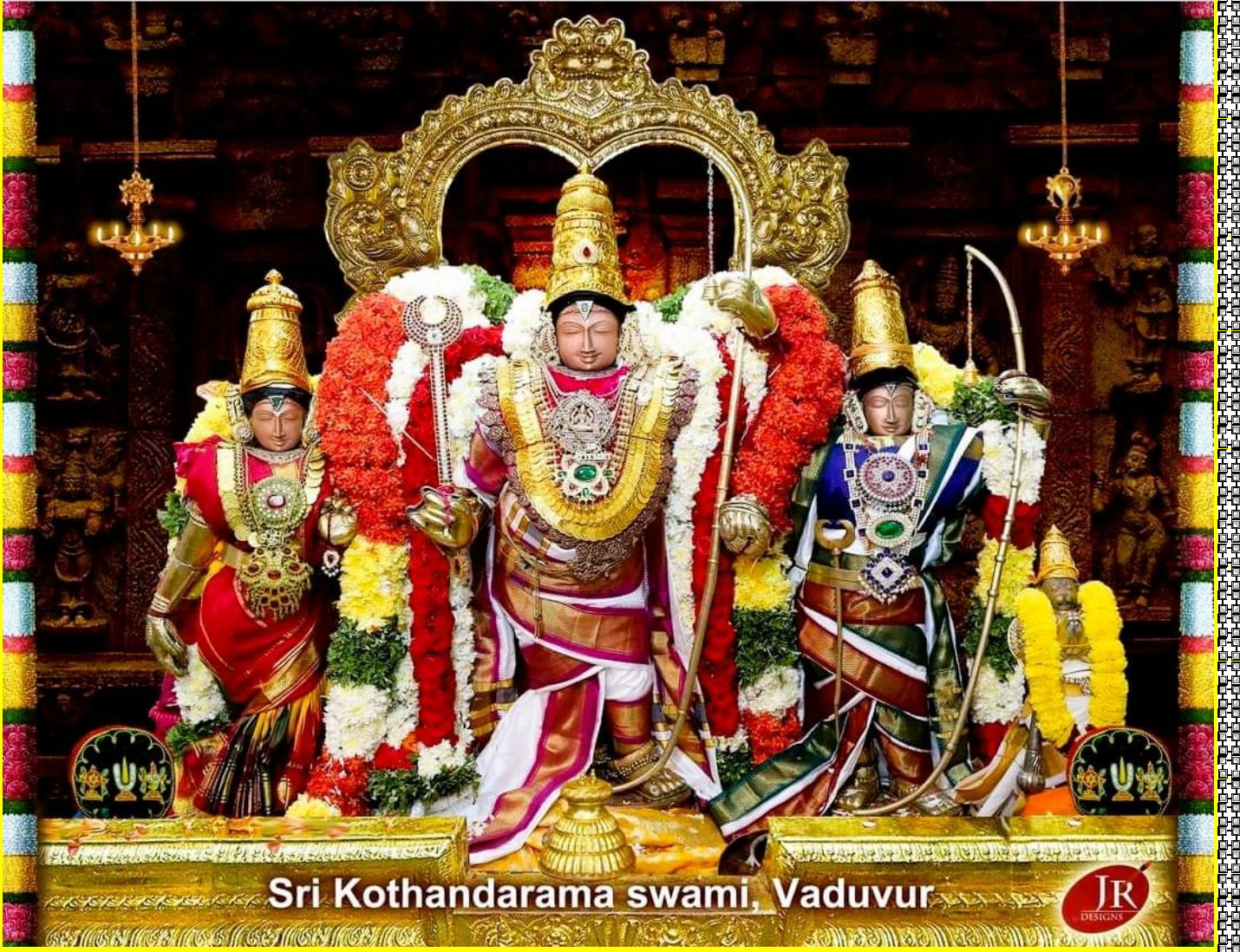
Sri Kothandarama swami, Vaduvur