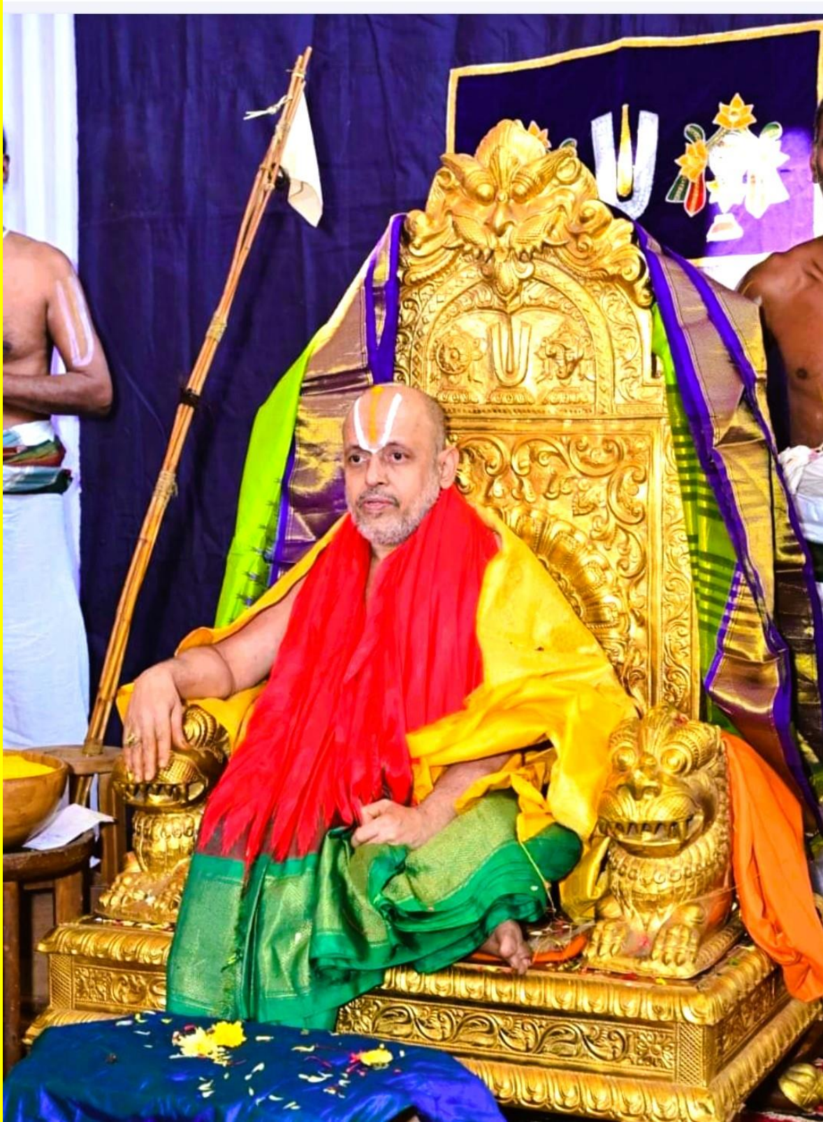
ஸ்ரீமதே ஸ்ரீ வராஹமஹாதேசிகாய நம: