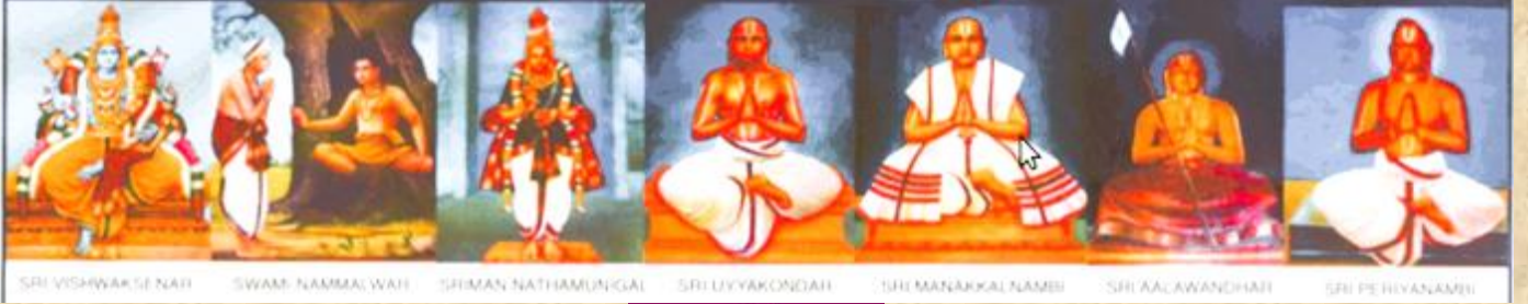
SRI VISHWAKSE NATH

ஸ்ரீராஜகோபாலஸ்வாமி திருக்கோவில், பெரிய கடைவீதி, திருக்குடந்தை.