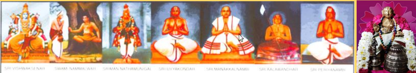
SRI VISHWAKSE NATH