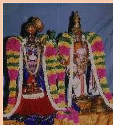
The Divine Couple: Andal and Ranganatha in Srivilliputtur