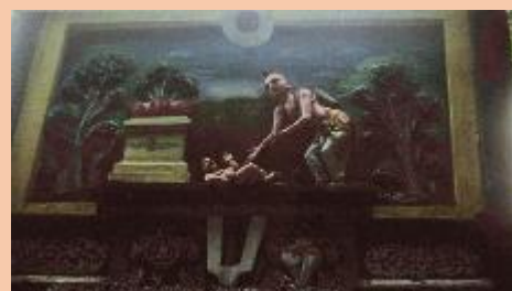
Vishnucitta discovering Andal. Sculpture above the tulasi garden in Srivilliputtur

flowers for the worship of the Lord at the local temple. One morning, as he went about his business, he discovered a baby girl lying under a tulasi plant in his flower garden. Having no family of his own, Vishnucitta felt it was God's grace that gave him this child and named her Godai, or "gift of Mother Earth." Filled with joy, he took her home and raised her as his own.