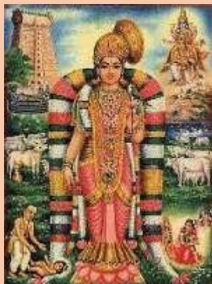
Traditional Painting of Andal

ideal bride, she would put the garland back for her father to take to the temple and offer to the Lord.