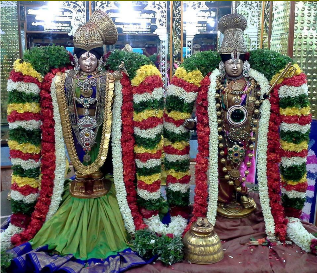
Sri Andal Rangamannar

Andal (Tamil: ஆண்டாளர், Āṇḍāl ) or Godadevi is the only female Alvar among the 12 Alvar saints of South India. The Alvar saints are known for their affiliation to the Srivaishnava tradition of Hinduism . Active in the 8th-century, [2][4] with some suggesting 7th-century, [3][note 1] Andal is credited with the great Tamil works, Thiruppavai and Nachiar Tirumozhi , which are still recited by devotees during the winter festival season of Margazhi . Andal is an important female figure for women in South India and has inspired women's groups such as Goda Mandali.